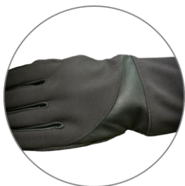
Softshell 3vrstvý laminát