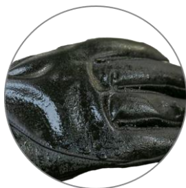
Větru a vodě odolná úprava