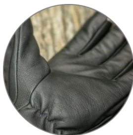
Useň kozina s hydrofobní úpravou