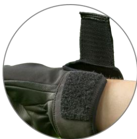
Rukavice je zakončena stahovacím páskem s velcro zapínáním