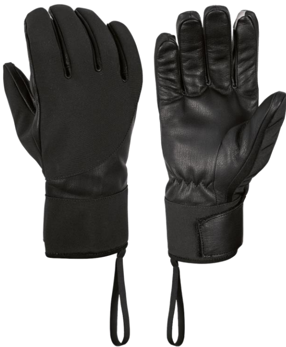
INES Short Black

Lehké citlivé softshellové rukavice do chladnějšího prostředí pro celodenní nošení s ochranou proti větru a vlhkosti. Určené pro armádní a policejní složky.