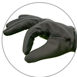
Pružnost a prodyšnost